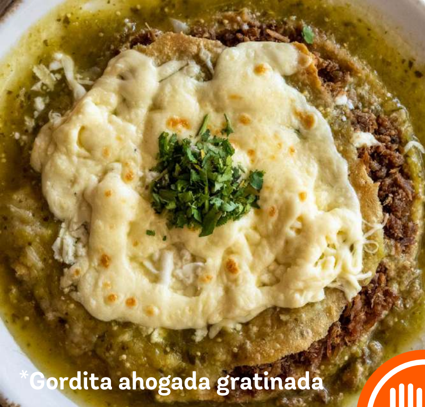
*Gordita ahogada gratinada