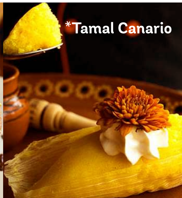
* Tamal Canario