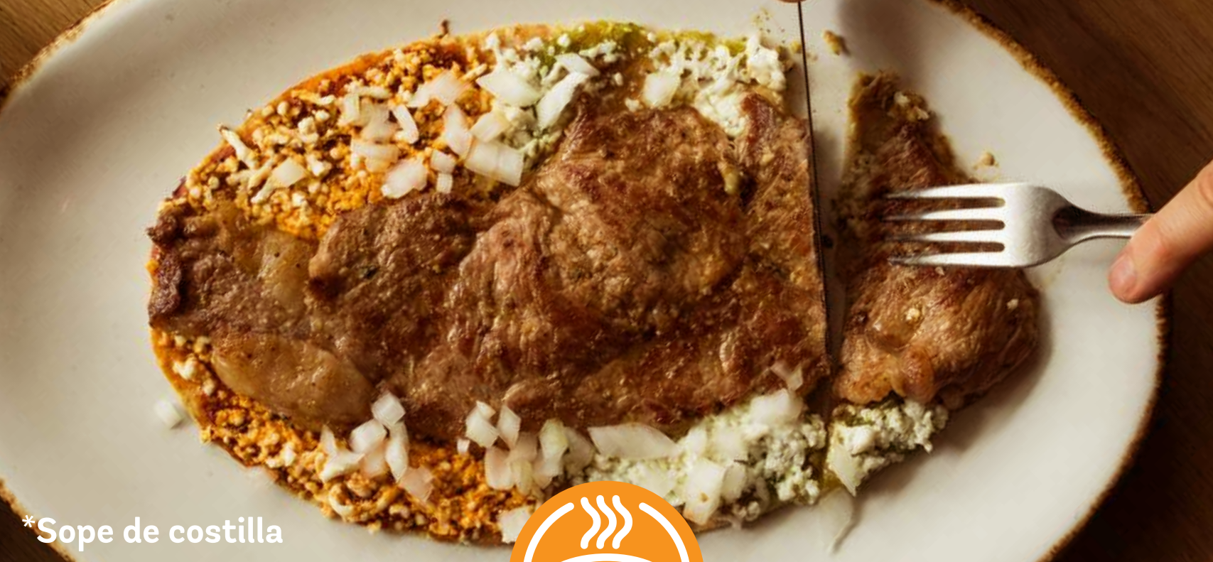
*Sope de costilla