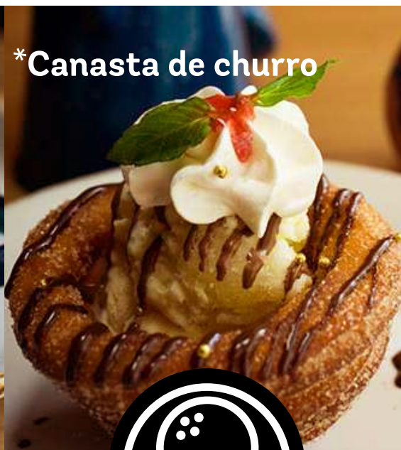
* Canasta de churro